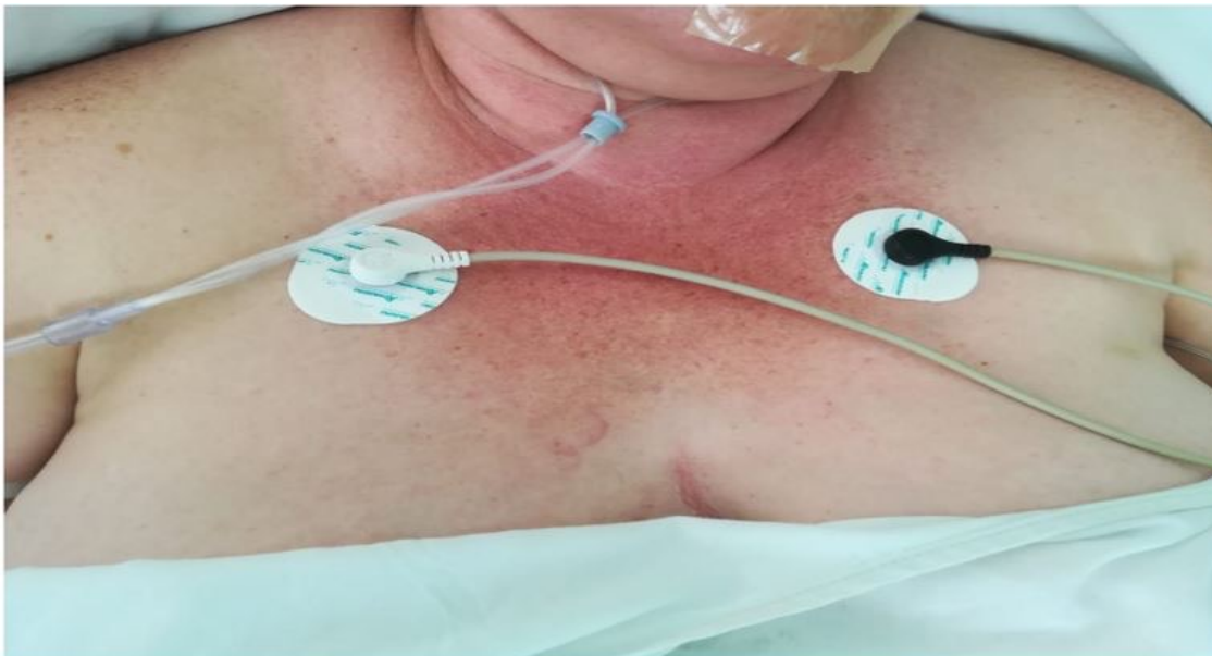
Figura 3. Dermatitis maculopapular eritematosa en región anterior del tórax de la paciente (signo de la "V").

horas continuó con mala mecánica ventilatoria y fue ingresada a la Unidad de Cuidados Intensivos (UCI) para manejo con ventilación mecánica no invasiva, donde se procedió con la colocación de parches dérmicos protectores para la piel y monitoreo continuo de signos vitales. Posterior a ello se realizó un ultrasonido Doppler venoso de miembros inferiores que reportó trombosis de la vena poplítea derecha que ocupaba el 80% del lumen venoso. Una hora después se realizó una angiotomografía de tórax donde se encontró un defecto de llenado de la arteria pulmonar izquier-