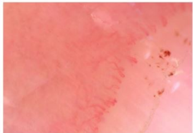
Figura 4. Estudio de capilaroscopia en la paciente, con presencia de capilares dilatados y áreas de microhemorragia.