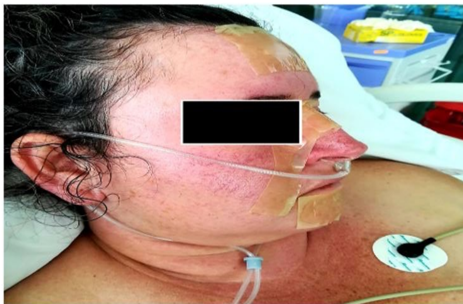
Figura 1. Telangiectasias faciales en el rostro de la paciente y presencia de parches protectores dérmicos posterior a ventilación mecánica no invasiva.

En las primeras horas de su ingreso al servicio de emergencia, se realizó un electrocardiograma y exámenes de laboratorio, los cuales resultaron sin alteraciones, también se realizó una radiografía de tórax en donde se observó una cardiomegalia grado 3, además de una ecocardiografía en la cual se evidenció dilatación del ventrículo derecho. Posteriormente se tomó una gasometría arterial donde se reportaron hallazgos compatibles con hipoxemia, acompañados de valores de lactato elevado. Debido al porcentaje bajo de saturación de oxígeno se le administró oxígeno por cánula nasal, sin embargo, a después de 2