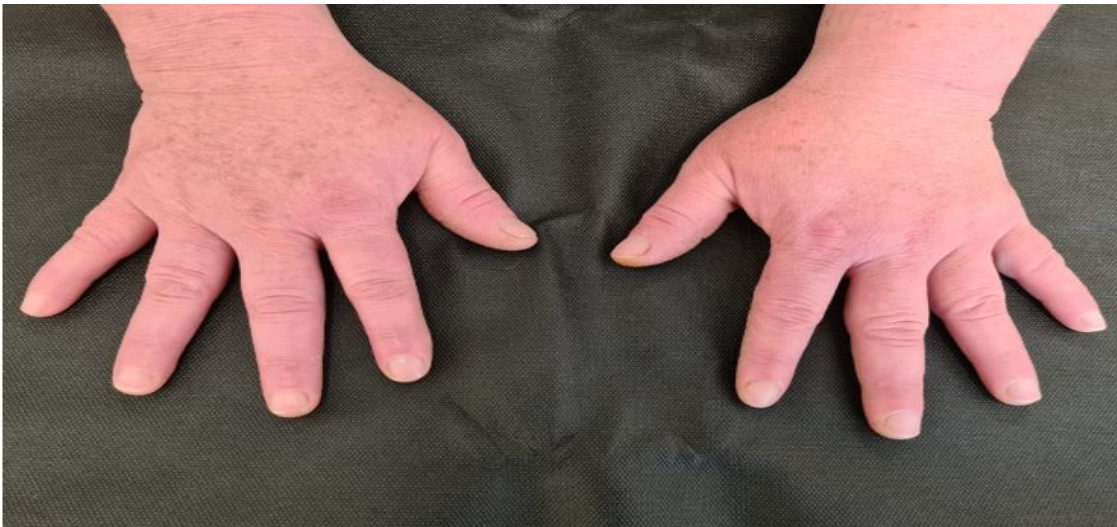
Figura 2. Edema difuso de manos y dedos de la paciente, aspecto de dedos en salchicha (puffy fingers)